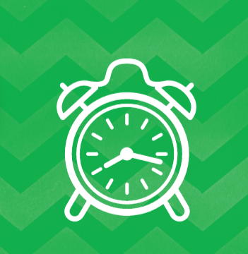
De hele kambeurt duurt zeker 15 tot 20 minuten!

HERHAAL MINSTENS OM DE 2 À 3 DAGEN GEDURENDE 2 WEKEN. ALS JE DE EERSTE DAG ALLE LUIZEN HEBT VERWIJDERD, KUNNEN ER TOT TWEE WEKEN DAARNA NOG NIEUWE LUIZEN UIT DE NEETJES KOMEN DIE JE NIET HEBT VERWIJDERD.