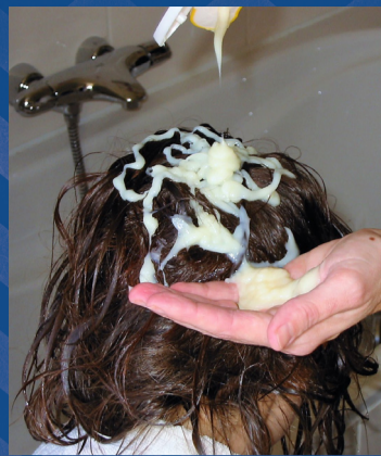
Doe veel conditioner (crèmespoeling/balsem) op het haar