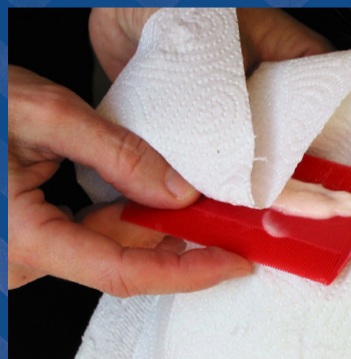
Veeg na elke kambeweging de luizenkam af aan het witte keukenpapier en kijk of je luizen kan zien. Met een tandenstoker kun je de luizen uit de kam verwijderen.