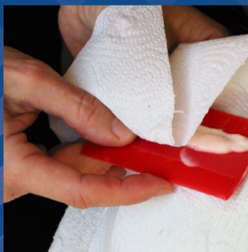
Veeg na elke kambeweging de luizenkam af aan het witte keukenpapier en kijk of je luizen kan zien. Met een tandenstoker kun je de luizen uit de kam verwijderen.